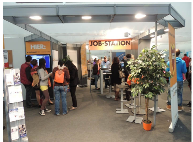
Die Jobstation mit vier Rechercheplätzen wurde über die Messetage von Interessierten aus allen Branchen durchweg gut besucht.