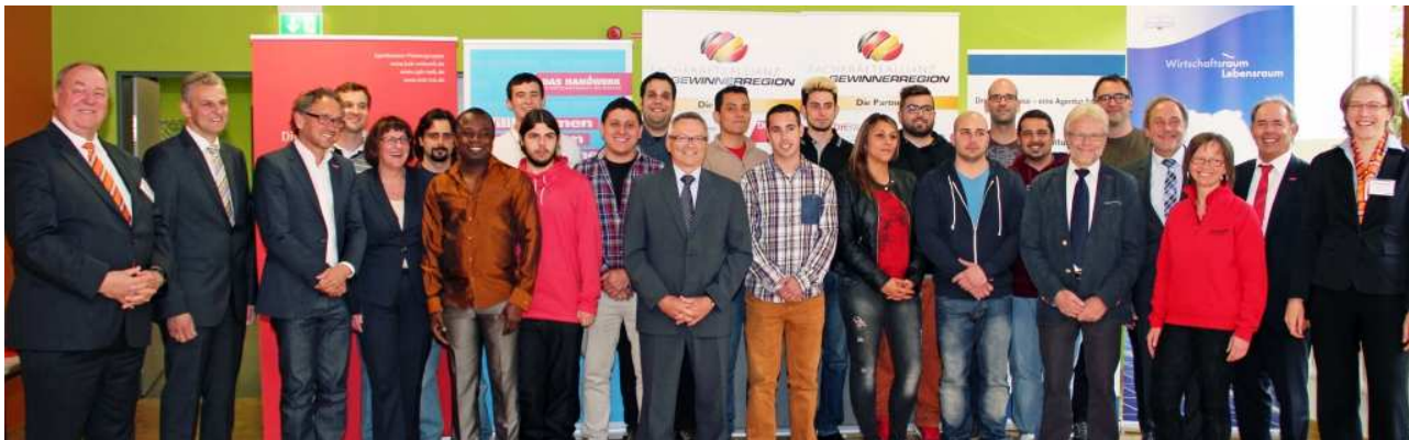
Die Partner und Unterstützer des Projekts „Spanische Auszubildende für das Handwerk 2014“ zusammen mit den Bewerbern aus Spanien, die seit Anfang Mai in Deutschland sind.

Anfang Mai sind die 20 Bewerber nach einem intensiven Auswahlverfahren in Villingen-Schwenningen angekommen und starten nun, nach einem vierwöchigen Deutschkurs in der Region, in ein dreimonatiges Praktikum in ihren neuen Ausbildungsbetrieben. Am 01.09. ist bei gegenseitigem Zuspruch dann die Übernahme in ein Ausbildungsverhältnis vorgesehen.